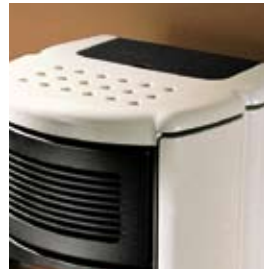
POIVRE-ET-SEL SALZ UND PFEFFER