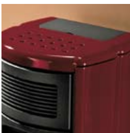
ROUGE BORDEAUX (avec craquelures) BORDEAUXROT (mit Haarrissen)