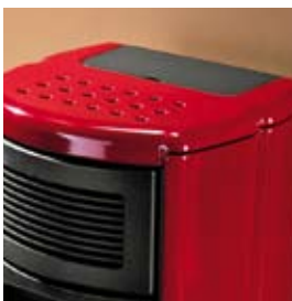
ROUGE ITALIE ROT ITALIA